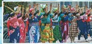
南京玉すだれ 楽しい会