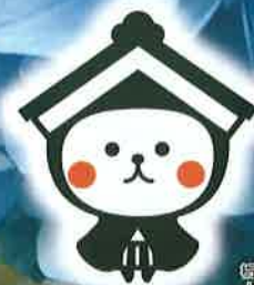
ゆるキャラ とち介