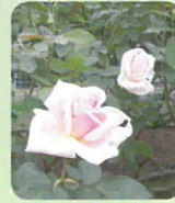
プリンセス・タカマツ