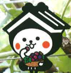
栃木市マスコットキャラクター とち介