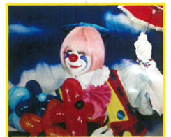
大道芸(クラウンカノン)