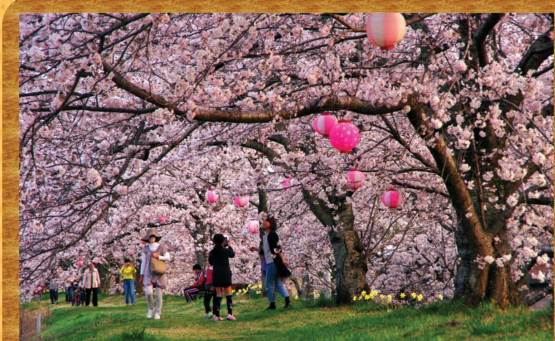
金崎のさくら賞(第5回作品)

◎詳細についてはHPからイベント情報を確認ください。 栃木市HP https://www.city.tochigi.lg.jp/ 観光協会HP https://www.tochigi-kankou.or.jp/