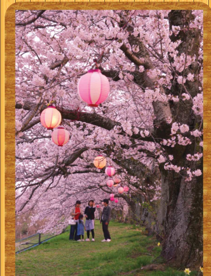
最優秀賞(第5回作品)