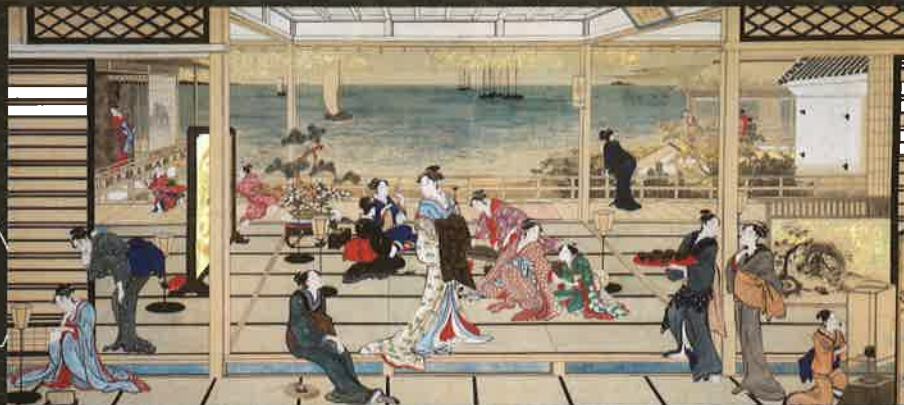
「品川の月」高精細複製画 (原本：フリーア美術館蔵 天明8年(1788)頃 147.0×319.0cm)