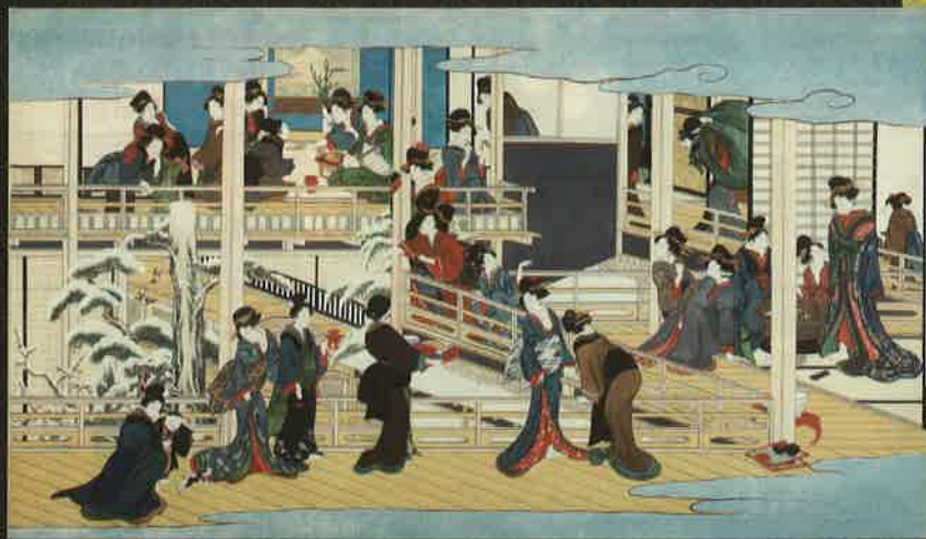
「深川の雪」高精細複製画 (原本：岡田美術館蔵 享和2～文化3年(1802～06)頃 198.8×341.1cm)