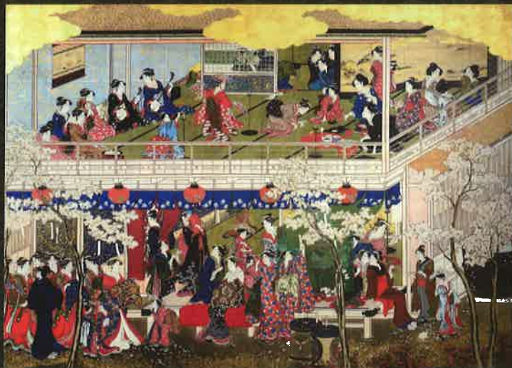
「吉原の花」高精細複製画 (原本：ワズワース・アセーニウム美術館蔵 寛政3～4年(1791～92)頃 186.7×256.9cm)