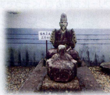
楠木正成 正行像(近龍寺)