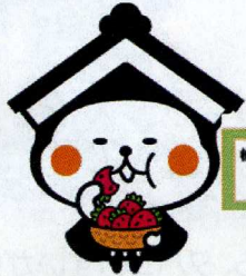
栃木市マスコットキャラクター とち介

栃木市 HP から引用 「ゆるキャラ for チルドレン 2016」 グランプリ！ とち介 フランス・パリへ進出！！