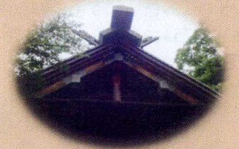
十の千木(ちぎ)で「とちぎ」

また、神明宮という神社は、「とちぎ」の名前の由来となったとも言われています。ここではかつて、すももも行われていたそうです。