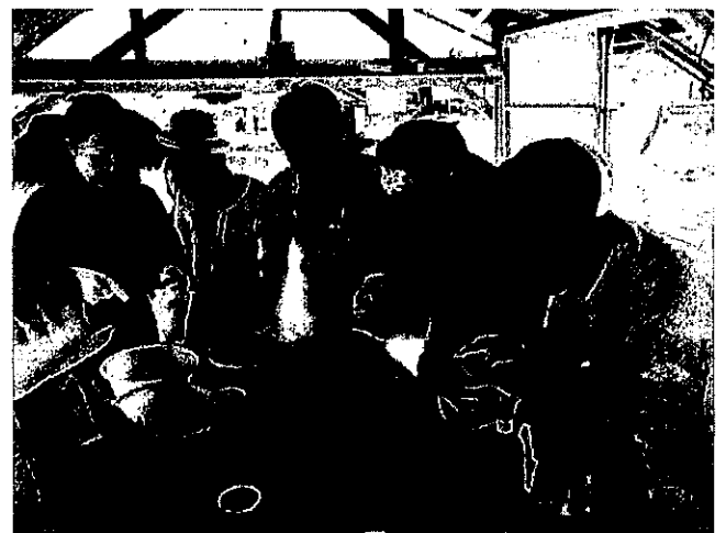
第13回観光庁長官賞 志摩市