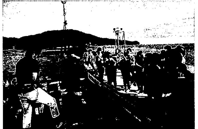
第13回金賞 広田湾遊漁船組合(広田湾漁業協同組合)